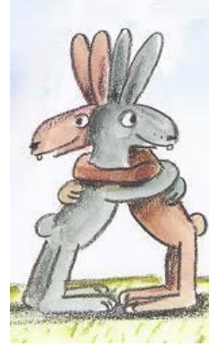
Boujon Claude. La Brouille. L'école des loisirs. 1989

Puisque j'ai parlé de collage, je vous montre ce qu'a fait une enfant de 8 ans à partir d'une image découpée dans un journal, elle a imaginé un ad-venir pour la petite fille ukrainienne. Même si un oiseau noir est toujours présent, il y a une remise en route.